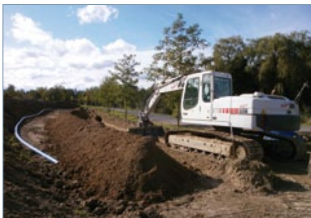
Vorhaben Trinkwasserringleitung Wilsdruff-Kesselsdorf

Kommunen als Gebietskörperschaften haben in einem überwiegenden Teil der von ihnen zu bearbeitenden Angelegenheiten einen Geografiebezug. Versteht man VISkompakt als umfangreiches Verwaltungsinformationssystem, welches auch von Interaktion zu GIS und Fachverfahren lebt, werden Mitarbeiter motiviert und Freiräume können für die eigentlichen Sachaufgaben genutzt werden. Das Recherche-