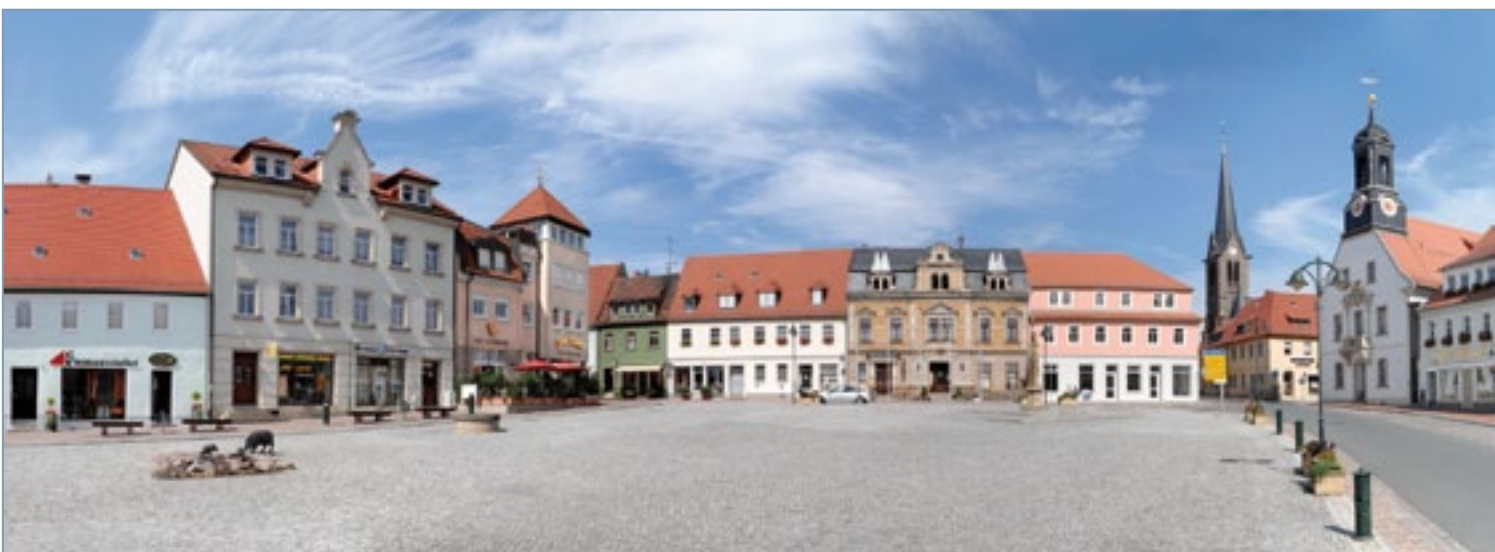
Markt von Wilsdruff

Bei Bauvorhaben bildet die Vermessung und Erstellung von Bestandsunterlagen den Abschluss der Projektphase und schafft die Voraussetzung für die Überführung des Vorhabens in den Verwaltungsprozess. Für die Kommune als Gebietskörperschaft sind die Vermessungsdaten, die in der Summe die Stadt-Grund-Karte bilden, von wesentlicher Bedeutung. Die SV Wilsdruff kollaboriert diesbezüglich mit dem Energieversorger ENSO und erstellt für die ENSO die Grundkarte für das Stadtgebiet Wilsdruff mit. Praktisch heißt das, dass die ENSO ihre aus Vorhaben hervorgehenden Vermessungen digital der SV Wilsdruff übergibt. Die SV stellt diese in das cardo-GIS ein und übergibt über einen Dienst die Digitale Stadt-Grund-Karte (DSGK) der ENSO.