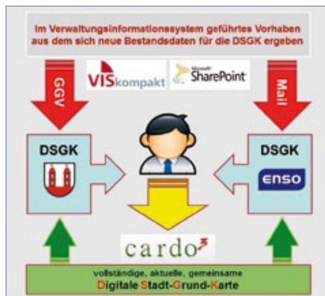
Veränderungsmanagement „DSGK“ mit externem Partner

ren in der Geografie nach Dokumenten mit bestimmten Eigenschaften, beispielsweise das Anzeigen aller Vorhaben in einem Ortsteil auf der Karte oder das Anzeigen einer Karte mit dem Vorhaben aus dem VIS-Vorhabensvorgang heraus, stellt einen wesentlichen Mehrwert nicht nur für die Bearbeiter, sondern insbesondere für Entscheider und Entscheidungsgremien dar.